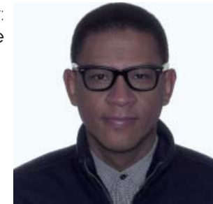
concepteur: Olivier Philippe

À travers la symbolique des trois types d'habitations du célèbre conte pour enfants Les trois petits cochons, l'installation aborde le débat sur l'exploitation du gaz de schiste de façon ludique en cherchant à sensibiliser un public de tout âge à la protection et la mise en valeur du paysage cultivable ainsi qu'à l'utilisation de sources d'énergie alternative pour remplacer celles dites traditionnelles.