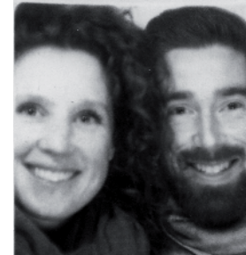
concepteurs: Valériane Noel et Félix Parent-Sirard

L'interactivité est une notion importante en architecture de paysage. En créant des espaces où la découverte et l'appropriation sont favorisées, l'architecte paysagiste développe chez le citoyen une sensibilité et un éveil à la qualité des lieux et des infrastructures qui l'entourent.