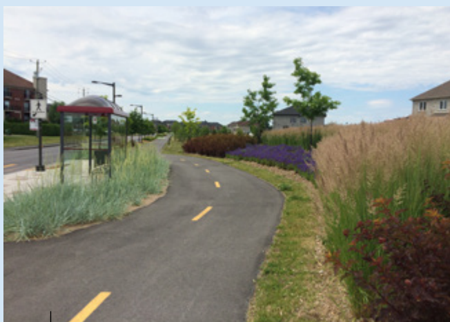
Réaménagement complet du chemin des Prairies, intégrant tous les modes de transport, tout en privilégiant la mobilité active. Implantation d'une piste multifonctionnelle, d'une traverse piétonne surélevée et de bandes végétalisées.

L'aménagement paysager du réseau va au-delà d'un simple embellissement; il doit prendre en considération tous les utilisateurs. Les concepteurs doivent toujours garder en tête que la ville doit demeurer à l'échelle humaine. Les interventions à privilégier dans le réaménagement de nos artères sont :