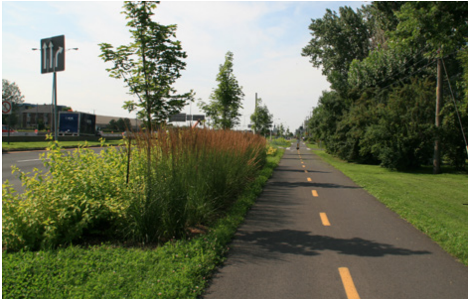
Implantation d'une piste multifonctionnelle sur le boulevard Marie-Victorin, le long d'une voie de service, et intégration paysagère

« L'avènement de grands projets immobiliers sur le territoire de Brossard depuis la dernière décennie a grandement contribué à revoir nos façons de faire en matière de développement du territoire. »